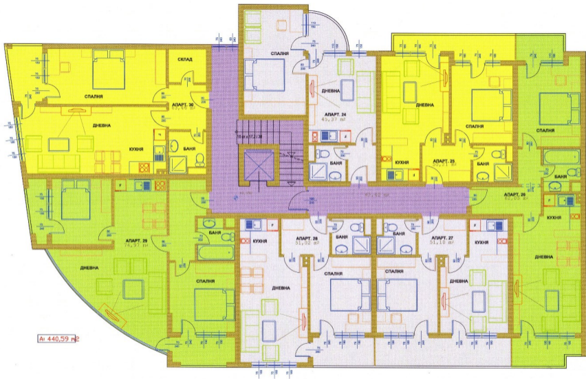
РАЗПРЕДЕЛЕНИЕ И ТЕХНОЛОГИЧНО ОБЗАВЕЖДАНЕ НА ПЕТИ ЖИЛИЩЕН ЕТАЖ М 1:50