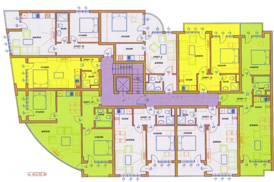
РАЗПРЕДЕЛЕНИЕ И ТЕХНОЛОГИЧНО ОБЗАВЕЖДАНЕ НА ТРЕТИ ЖИЛИЩЕН ЕТАЖ М 1:50